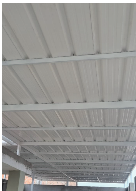
Estructura de fijación interna