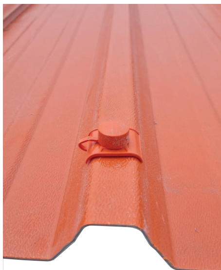
Cubierta de fijación contra la corrosión